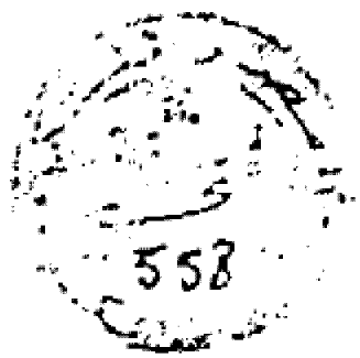
الورقة الأولى من النسخة م

ينسب القيد الترخيم نفسه ظل الله تعالى في يومه الذي وقع فيه ما كثر به من الأثر ليس وبنسبنا وصفانها و اصفا عنها ومرتبا وجمالها وانتمارها وعجلها وما خفت به من العظايل والبركات والجوامع والعلل والاشجار والنبات وذئرتيها من بلخ واللوك وبعير الطوباء والاسد حها الماس وما وليها من آراء العرب من العجم وظلمها وخلعها لأموريين والحمود يبر العلويين والرواة العامية الغلابيين بدولة هملع المويين من الشوار المتخالفين علينا بفرع وما ملكها من ملوك المرابطين والموحدين وبنه من يرويه همد وبنه نصر وبنه اشعبلولة وبناته بجانة اشعبلولة بنه الج في الأول منه وذئرتيها لسوقها